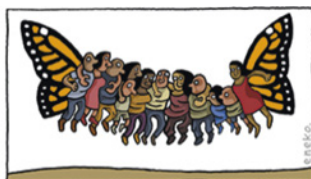
XIX Jornada Desigualdades Sociales y Salud, Cádiz, 17 de octubre de 2019.

La Asociación para la Defensa de la Sanidad Pública de Andalucía (ADSP-A) presenta el programa de la “XIX Jornada sobre Desigualdades Sociales y Salud” que se celebrará en Cádiz, el 17 de octubre de 2019. Programa e inscripción: http://saludaccionyequidad.es/