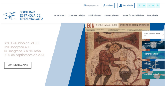
La Sociedad Española de Epidemiología

Así mismo se han generado importantes impactos con la nota de prensa difundida para hacer un llamamiento a la prudencia de cara a la Semana Santa y minimizar las consecuencias de un nuevo impacto de la covid-19. De igual forma, se han generado noticias a raíz de las notas de prensa elaboradas sobre el Día Mundial de la Tuberculosis y sobre la webinar organizada desde la SEE para hablar de las consecuencias de la pandemia en el cribado de cáncer.