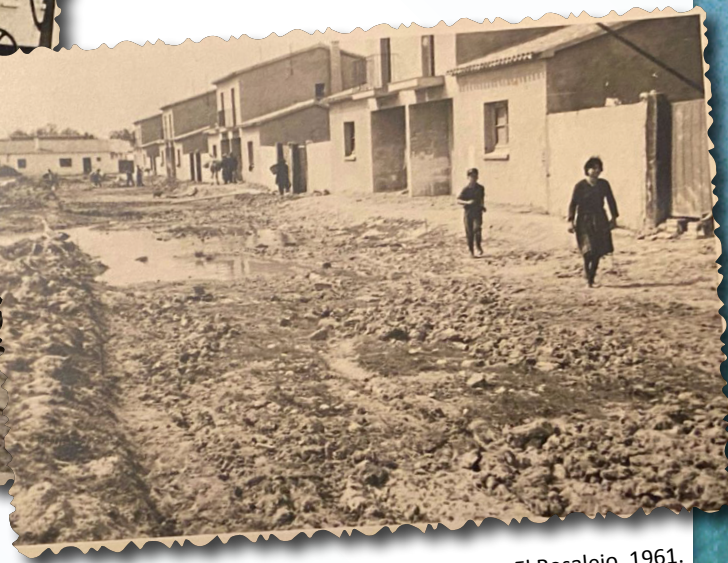
Poblado El Rosalejo, 1961.