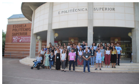
Fotografía tomada durante la celebración de las IV Jornadas de Jóvenes Investigadores de la SEB

Los jóvenes bioestadísticos constituyen uno de los pilares fundamentales de la SEB. Por ello, los miembros estudiantes de la SEB tienen una cuota de inscripción gratuita durante el periodo de estudios, tanto si son de Grado o Licenciatura, de Máster y Doctorado, así como si son becarios de alguna institución reconocida oficialmente. La SEB, en su afán de promocionar la actividad investigadora de los jóvenes bioestadísticos, celebró el pasado 5 y 6 de septiembre la cuarta edición de las Jornadas Científicas de Estudiantes de la SEB. Estas jornadas, que tuvieron lugar en la Agrupación Politécnica del Campus de Albacete de la Universidad de Castilla-La Mancha, fueron un éxito, al igual que las anteriores: 8 sesiones, 34 presentaciones, 6 pósteres, 1 curso de estadística espacial, 1 mesa redonda, y un activo programa social. Las próximas jornadas se celebrarán en Valencia en enero de 2021.