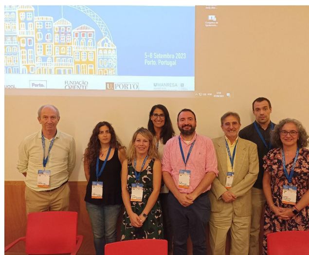
Miembros del grupo de trabajo y colaboradores

La sesión, que suscitó un gran interés entre los asistentes, sirvió para subrayar la importancia y complementariedad de las distintas fuentes de información epidemiológica sobre salud mental y su contribución a la toma de decisiones sanitarias y a la planificación de servicios. Además, se resaltó la importancia de contar con los ejemplos que pueden aportar las experiencias en otros países y las posibilidades que ofrece el uso de real world data en epidemiología psiquiátrica.