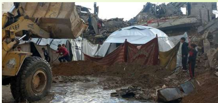
Los niños se refugian cerca de una tienda improvisada entre los escombros y las inundaciones, mientras las fuertes lluvias azotan Gaza.

Todo ello ha sido calificado por Volker Türk, Alto Comisionado de la ONU para los Derechos Humanos como una medida “espantosa” y la enmarcó en un patrón más amplio de restricciones. Se denuncia que la prohibición y cese de actividad se basa en criterios vagos y politizados, y que exige condiciones para operar incompatibles con los principios humanitarios y las obligaciones legales internacionales. Así mismo, se instó a los Estados con influencia a presionar para que Israel permita de inmediato la entrada sin trabas de ayuda y acceso humanitario a Gaza. ONU declaracion . Entre ellas, España y otros 5 países europeos han manifestado su apoyo a UNRWA y las ONGs.