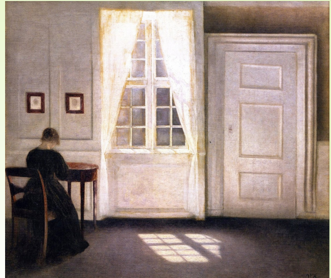
Vilhelm Hammershøi. Interior en la calle Strand, Luz del sol en el piso, 1901.

Gaza, y tantos otros, es el conflicto que hoy expulsamos de nuestro campo visual aquellas personas que tenemos el privilegio de poder hacerlo. Frente a los interiores silenciosos de Hammershøi, que invitan a la contemplación y al recogimiento, se impone la pregunta incómoda sobre qué silencios elegimos habitar y cuáles contribuimos a sostener. Quizá el verdadero desafío consista en no confundir la calma con la indiferencia.